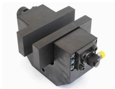
MS135-60-A Hydraulisches Spannzeug für große Backen