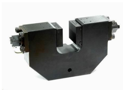
MS135-60-d Hydraulisches Spannzeug - symmetrische Ausführung mit 2 gegenüberliegenden Hydraulikkolben

Spannbacken mit weiteren Abmessungen und Oberflächenbeschichtungen auf Anfrage