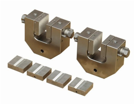
MSS90+BP und MSS90-BV