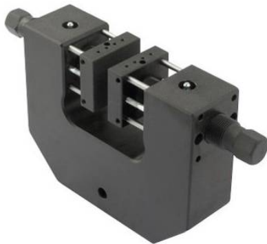
MSS90-S70+PB 70mm Öffnungsweite